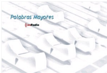
Nesplora presentará su programa Isla Calma a los oyentes de Palabras Mayores