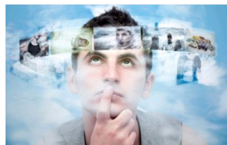
Un sistema de realidad virtual permite distraer el miedo al dolor en los pacientes

Un estudio de la Universidad de Barcelona sobre el uso de realidad virtual en consulta publicado el pasado año en la revista Studies in Health Technology and Informatics revelaba que "la mayoría de los participantes que experimentaban distracción con realidad virtual interactiva reportaron menos intensidad del dolor". Este resultado era menor en el caso de realidad virtual pasiva.