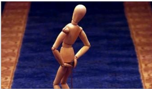
El dolor tiene un componente psicológico, distráelo.